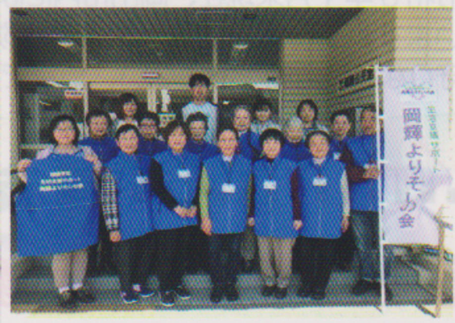
岡輝よりそいの会メンバーのみなさん

「自分たちの大好きなまちで暮らし続けたい」 「そしてなにより自分たちの活動が楽しい」 「人の支えになることが自分の支えになる」 そんな気持ちを強く持つことで、気持ちが行動力となり、たくさんの助け合い活動が実現しました。将来的には、自然に隣近所で支え合えるまちになり、住み慣れた地域で暮らし続けることができるように今後も楽しみながら活動します！