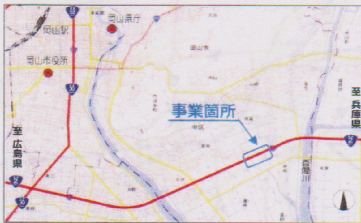
出典：国土院ホームページ（http://portal.cyberjapan.jp） ※地理院地図（電子国土Web）を加工して使用しています。