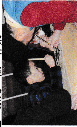
2019.2.9 篆刻完了 墨仕上