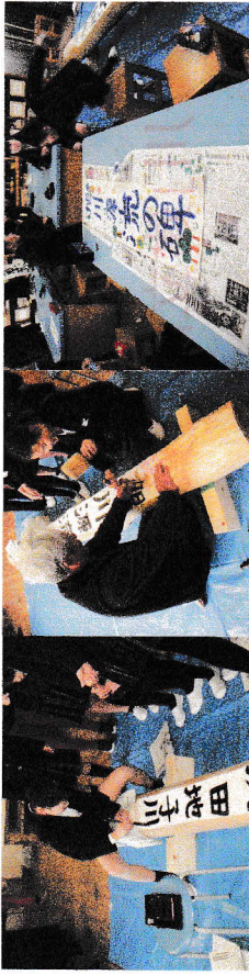
2019.1.8 建部小学校・揮毫・篆刻・幟 作業