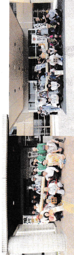
2019.5.18 富山公民館到着 2019.5.25 ふれあいセンター到着

建立までの経緯 2018.11.20 建部小学校「水と川と私達」。2018.11.24 原木伐採・皮むき。2019.2.15 岡山市北区建部小学校出発→岡山市北区建部小学校到着。2019.2.22 岡山市北区建部小学校出発→岡山市北区建部小学校到着。2019.3.9 岡山市北区御津公民館到着。2019.3.16 岡山市北区牟佐公民館到着。2019.4.6・7 岡山市中区操山公民館到着。2019.4.20 岡山市南区福浜公民館到着。2019.4.27 岡山市北区岡輝公民館到着。2019.6.1 岡山市中区ふれあいセンター到着。2019.6.1 岡山市中区富山公民館。2019.5.25 岡山市中区富山公民館→岡山市中区ふれあいセンター到着。2019.5.18 富山公民館到着。2019.5.25 ふれあいセンター到着。