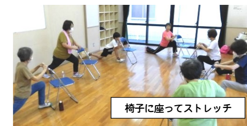
椅子に座ってストレッチ

参加した子どもたちもクラブ講座の皆さんも楽しい時間を一緒に過ごしました。来年もまたご協力をよろしくお願い致します。