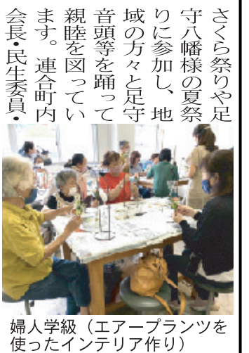
婦人学級(エアープランツ)を制作したインテリア作り

足守学区婦人は、地域連携や会員同士の交流を大切にして各種活動を行っています。まず地域連携です。