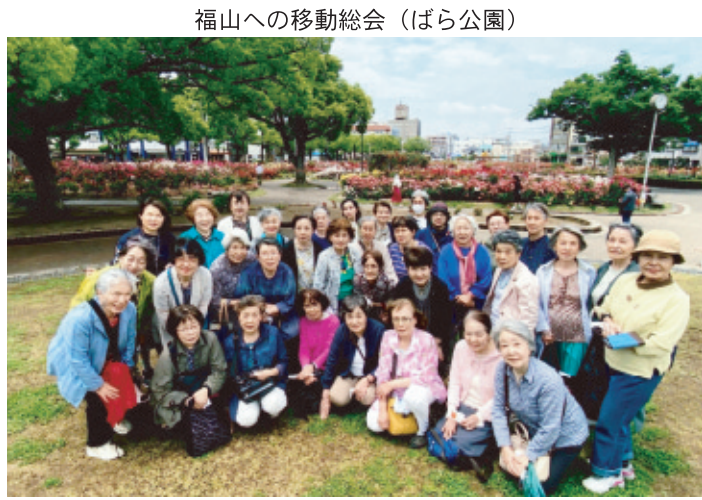
福山への移動総会（ばら公園）

五月には、移動総会「福山城・ばら公園」を訪れました。福山市の歴史を学び、戦後復興の為に立ち上がった市民の熱意に心打たれました。