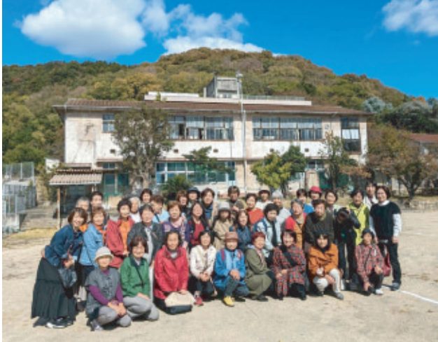
婦人学級(研修旅行)

足守学区婦人は、地域連携や会員同士の交流を大切にして各種活動を行っています。まず地域連携です。