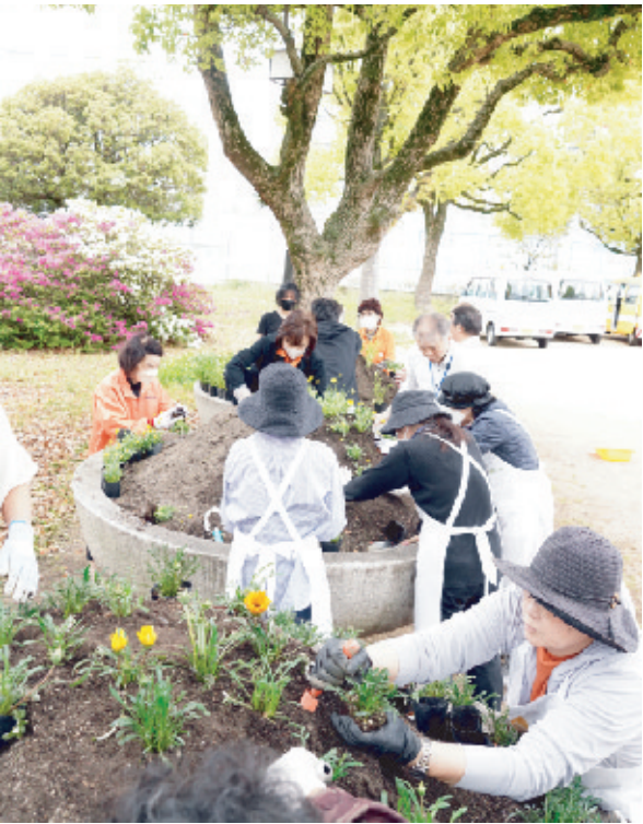
元気に育つように1苗1苗丁寧に植え込んでいく会員ら

令和六年四月二十三日（火）南方公園（婦人の森）で春の花植えを行いました。前日雨が降り当日の作業ができるかどうか心配しましたが、雨も上がり曇り空の中作業することができました。