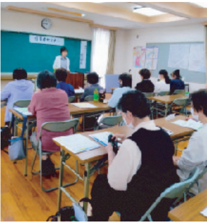
消費者セミナーで学ぶ婦人会員ら

雄神学区は、岡山市東区を流れる吉井川に接していて、JR赤穂線西大寺駅の周辺にあります。学区の南は、