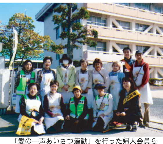
「愛の一声あいさつ運動」を行った婦人会員ら

思いました。平福学区婦人は、新学期が始まる時に合わせて年に三回「愛の一声あいさつ運動」を行ってきました。平福小学校の校長先生も「進んであいさつできる子」を重点目標として指導に当たられ、地域との絆を深めてほしいと言われ、婦人会も少しでもお力になれればと協力させて頂いています。運営委員の子ども達も「あいさつ運動」に参加してくれました。また、地域