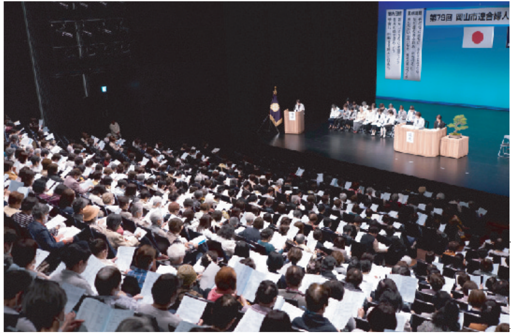
総会で挨拶する塩見会長と来賓、役員ら