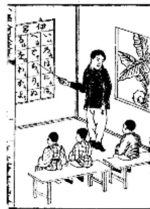
図1 授業風景 (1)

明治5年、東京師範学校は、欧米の教科書を参考に、翻訳や翻案によって教科書の刊行にあたり、翌年には米国で刊行されていた各種の初等教育用チャートを模して、「五十音図」「数字図」「単語図」「連語図」などの掛図（約80×60cm）を作製した。文部省は、明治7年（1874）8月、師範学校編集の掛図を改正して30