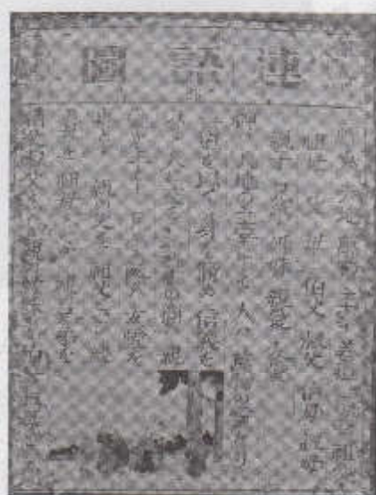
図2 第一連語図