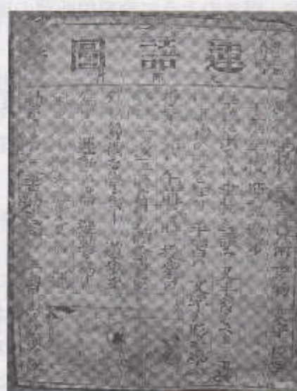
図3 第二連語図