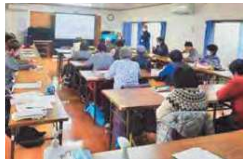
ゆる〜いつながりの会