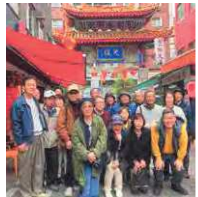
親睦バス旅行(神戸R8.2.15)

しかし、ご多分に漏れず、メンバーの減少・高齢化が進み、若者(壮年)の加入が望まれるところですが、なかなか難しいのが現状です。「FRC」に限らず、若者(壮年)が主体的に、自由に楽しく集う場を作り、活動することによって町内会全体の活性化につながればと考えます。町内会としても核となりそうな人たちに声をかけていきたいと思えます。