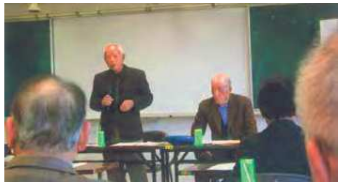
定廣会長代行開会あいさつの様子

今年もすでに山陰での地震により、岡山市では被害こそ無かったものの、相当な揺れを感じました。いつ起こるか分からない災害です。日頃からの準備の必要性を再認識する研修となりました。