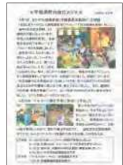
宇垣原町内会だより

私たちは、地域密着の医療と介護と保育の融合を目指しています。 医療にも老後にも安心して暮らせる地域づくり。 その暮らしは、どれほど豊かでしょうか。 これからの日本に求められる、医療・介護・保育の あるべき姿だと信じています。