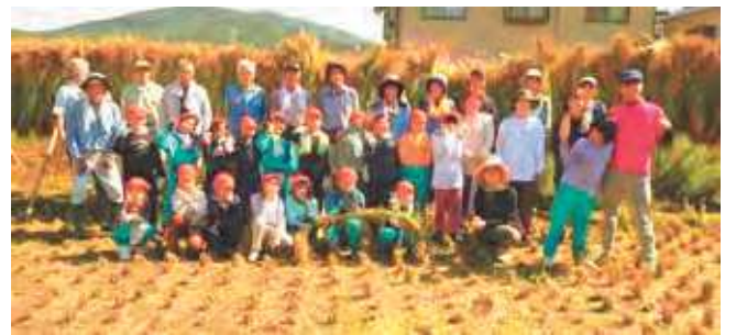
わーい！みんなでやりとげたよ！！

豊かな自然を守りながら、町民から「ありがとう」と言ってもらえるような地域づくりがしたいと思います。