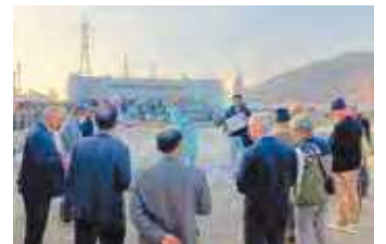
砂川左岸橋脚部の説明