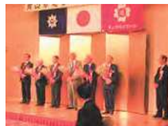
令和7年中の各種受賞者の方々