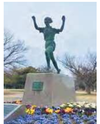
県総合グラウンドにある人見絹枝像

これからも福成が皆様にとって「ずっと住み続けたい、自慢のふるさと」であり続けられるよう役員一同努めてまいります。ぜひ私たちと一緒に心地よいまちづくりを支えていただけませんか。皆様の暖かいご参加とご協力を心からお待ちしております。