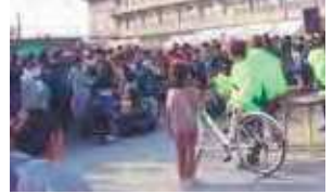
新春互礼会の様子