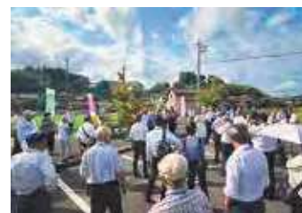
視察の風景(造山古墳)