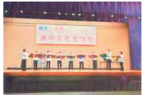
灘崎文化まつりの一コマ

今後も地域の文化を守り育て、灘崎地域の文化度を高め、灘崎の住民の繋がりを深め、住民が誇りを持てる灘崎づくりを進めてまいります。