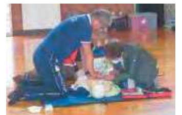
岡山市総合防災訓練の様子