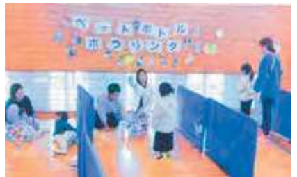
ペットボトルボウリング大会