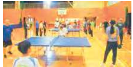
卓球を楽しんでいる様子

これらの活動を通じてこの場が地域の方の問題や悩みが解決する交流の場所に成ってもらいたいです。