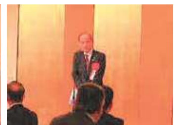
大森市長から祝辞の様子