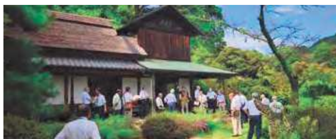
視察の風景(近水園)