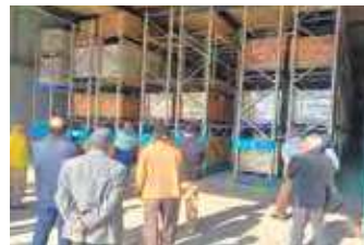
東区大型備蓄倉庫内部の説明

今回の視察では、すでに操業している事業所説明を受けて「素晴らしい」と思いました。また、要望していた部分の完成が見えていますので、引き続き着実によりしくお願いいたします。