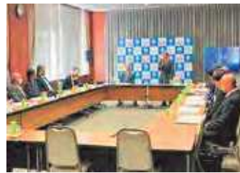
市長あいさつの様子