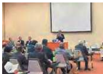
来賓からの祝辞(大衆市長)

視察の場は終始和やかな雰囲気に入れられ、三市の絆をさらに深める充実したひと時となり、交流会をきっかけとしますますの親睦と交流を積み重ねてまいりたいと思います。