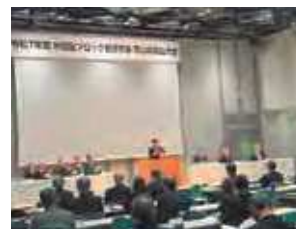
伊原木県知事あいさつ