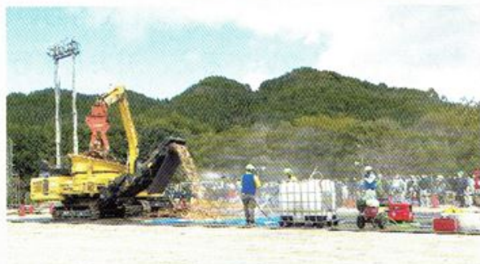
木くず破碎処理実演、散水訓練

令和3年11月11日、県主催の災害廃棄物仮置場設置訓練が真庭市勝山運動公園で開催され、岡山県、真庭市及び協会の参加者64名と見学者83名が集まりました。協会からは総員80名が参加し、悪天候の中、敷鉄板・散水用資機材の設置訓練、木くず・畳の破碎処理実演、また、搬入車両の受入訓練、保管廃棄物の飛散防止・土間選別・温度管理等の訓練を行いました。災害廃棄物処理の初動対応で最も重要な仮置場設置について、この実地訓練を通じ行政との連携を深めるとともに協会内の初動体制構築の第一歩となりました。