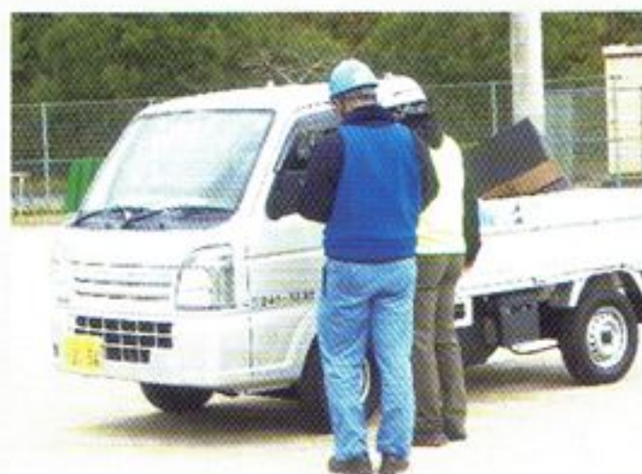
搬入車両受入訓練

※ 今後も賛助会員の紹介記事を掲載予定としています。紹介した取組・活動を参考にいただければ幸いです。