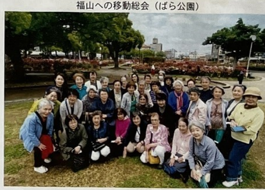
福山への移動総会（ばら公園）

十月に、岡山市と連合婦人会からの「敬老お祝品」を該当者全員にお声をお掛けしました。