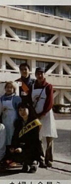
「愛の一声あいさつ運動」を行った婦人会員ら

今年度は寒い日が続いて、桜の花びらが舞うのを背に校門をくぐる新入生を見て、やはり入学式は、桜が一番と