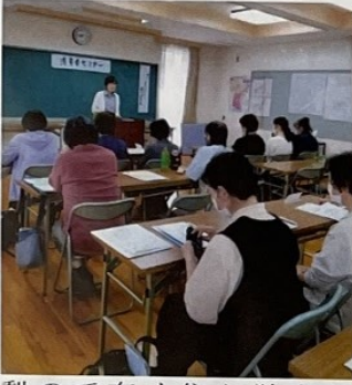
消費者セミナーで学ぶ婦人会員ら

雄神学区は、岡山市東区を流れる吉井川に接している、JR赤穂線西大寺駅の周辺にあります。学区の南は、