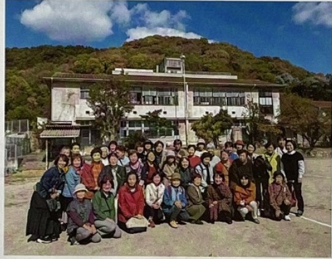
婦人学級（研修旅行）

足守学区婦人は、地域連携や会員同士の交流を大切にして各種活動を行っています。まず地域連携です。