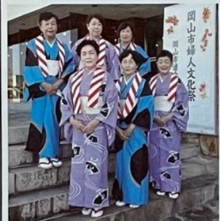
岡南学区 (ふるさと武雄豊年まつり)