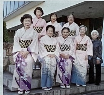
三動学区 (阿波池田小唄)