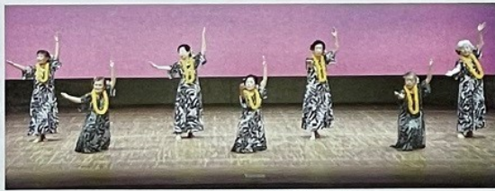
御津学区 (南国の夜他)