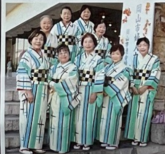
三門学区 (宮崎音頭他)