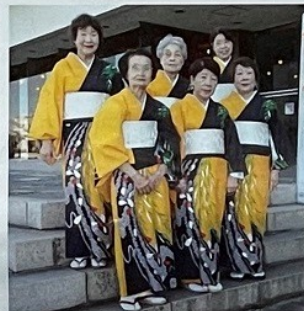
連合婦人会 (木更津甚句)