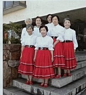
旭操学区 (ローズ・オブ・マイ・ハート)