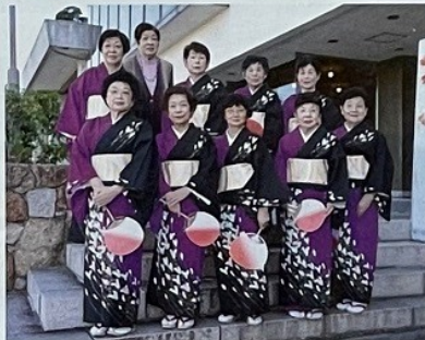
平福学区 (弘前小唄他)