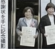
感謝状を手に記念撮影