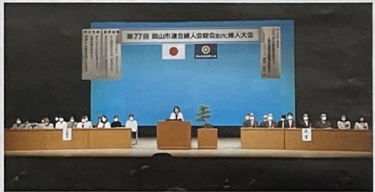
岡山市連合婦人会総会