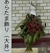
あらたま飾り(大井)

大井地区は山に囲まれた地域にあります。昔はお正月には稲藁のお飾りや、玄関やお床にお飾り餅と共に花を生け込みお正月を迎える習慣が各戸に見られました。