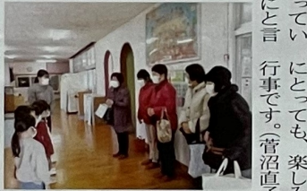
園児へマスク贈呈(平福)

物」として、お届けした時の様子をきれいにレイアウトして園内に掲示し、みなさんに紹介してくださいました。うれしかったです。幼稚園ではクラス