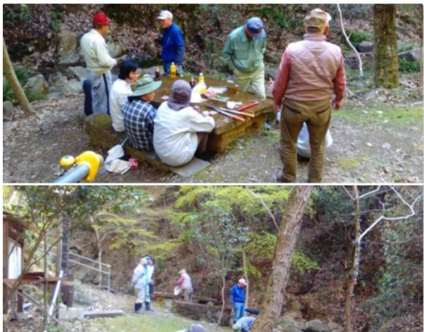
守る会の会員による清掃活動