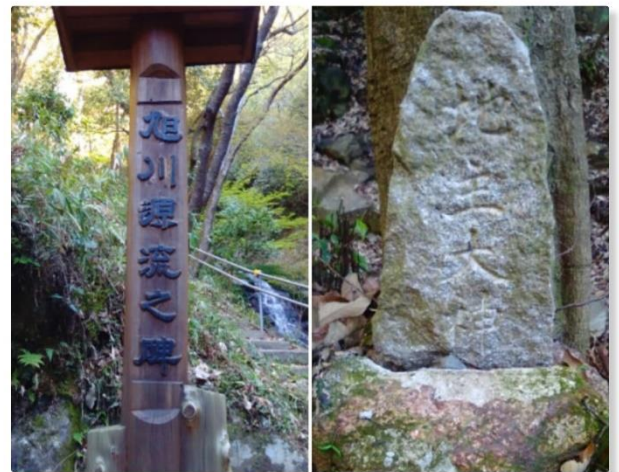
滝への山道脇に地主大神と源流の碑