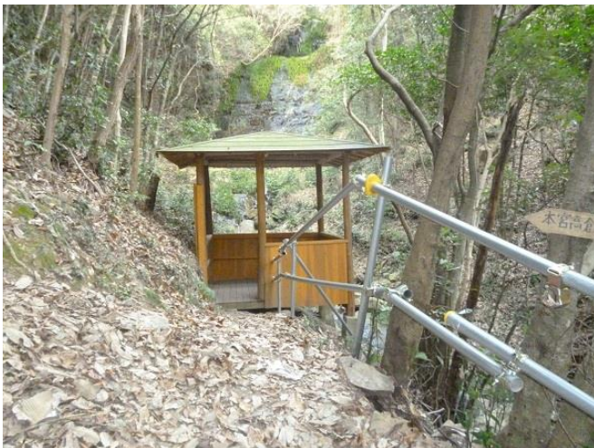
上の段にある四阿造りの休憩所