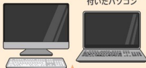
PCリサイクルマークの 付いたパソコン

PCリサイクルマークのないノートパソコンは、 小型家電の回収ボックス、 デスクトップパソコンは粗大ごみ