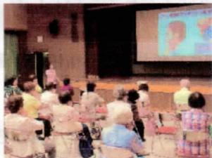
お口を潤す、お口の体操