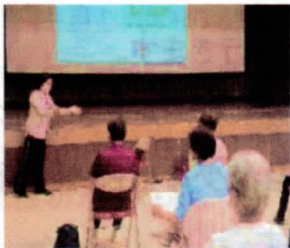
フレイル予防に大事な講話