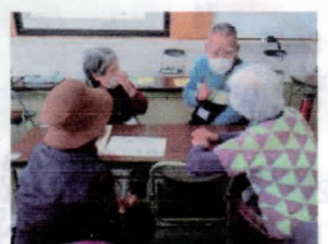
交流で脳を活性化