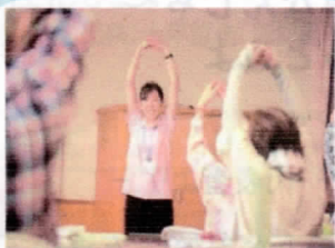
安全に取り組める ストレッチ体操