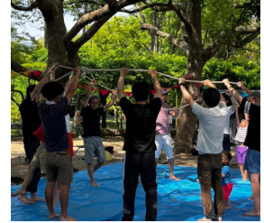
パパの準備体操(笑)