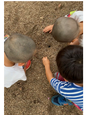
穴の中に何かがいる…