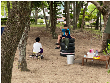
何もしなくていいのもプレーパーク