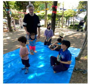
ちっちゃい子に高校生がウクレレ弾いてくれましたー