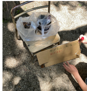
カフトムシむりょうであげます。カフトムシを持ってきてくれました。