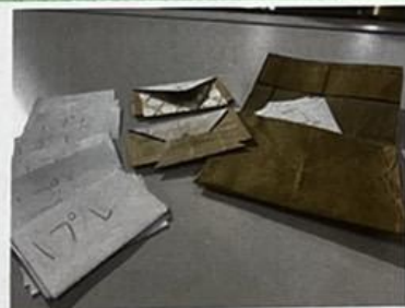
財布屋がつくった財布