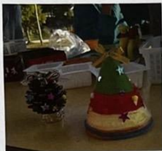
クリスマスツリー つくったよ。