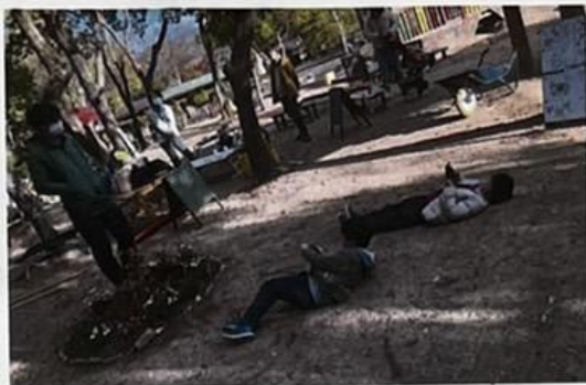
マッキー、モデルになる。 カメラマンはこのアングルになりがち？