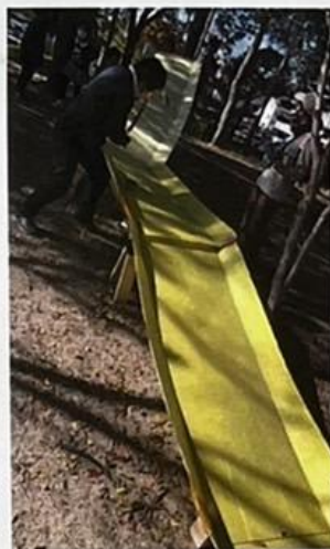
牛乳パックカーレース