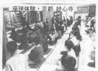
座禅体験・京都 妙心寺