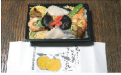
栄養委員手作りのバラ寿司

今年度の「ふれあい会食会」(七十歳以上の一人暮らし高齢者対象)は九月八日に計画されていましたが、