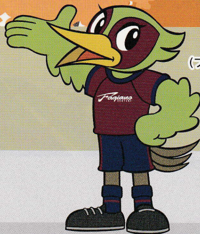
ファジ丸 (ファジャーノ岡山)