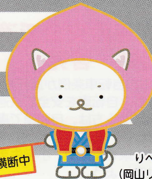
りべきち (岡山リベッツ)