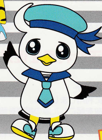
ウィンディー (岡山シーガルス)