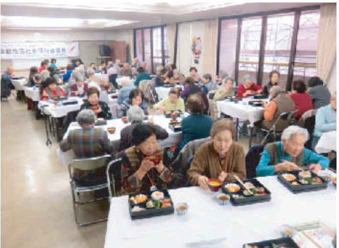
栄養委員手作りの弁当に舌鼓を打つ参加者