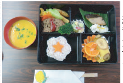
栄養委員の手作り弁当

令和2年度も御野地区社会福祉協議会では引き続き「元気の出る会」を実施します。「元気の出る会」についての問い合わせは、各町内の民生委員をお願いします。