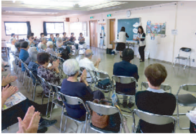
交通指導員の話に熱心に聞き入る参加者