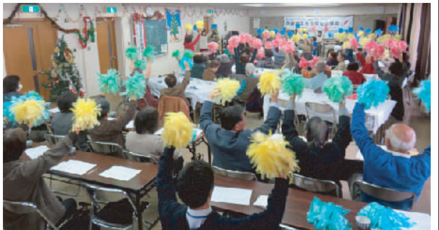
赤、黄、青、緑のポンポンを振って楽しむ参加者