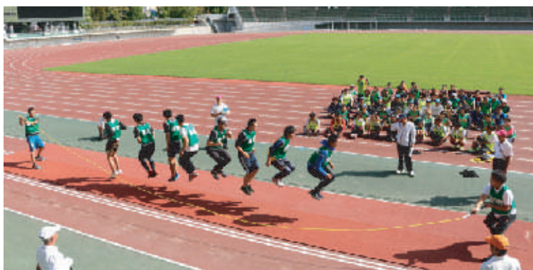
長なわとびに参加する御野チーム