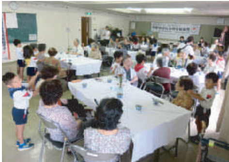
園児に肩をたたくてもらい、笑顔の参加者

同集いは、一人暮らし高齢者の日ごろの労をねぎらい、地域での「ふれあい」と「絆」を深めようと、毎年この時期に行われています。