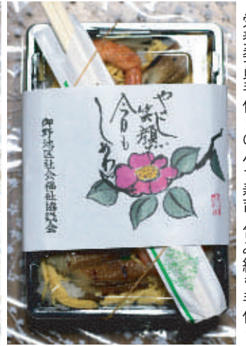
栄養委員手作りのバラ寿司。包み紙も手作り