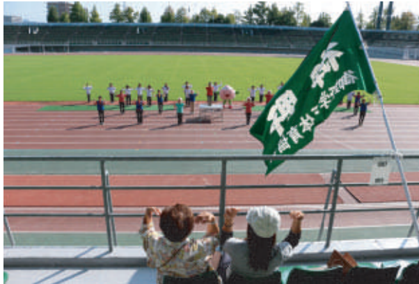
開会式後に「OKAYAMA! 市民体操」で準備体操