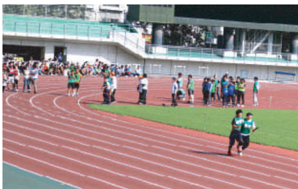
トップを走る「二人三脚リレー」の御野チーム