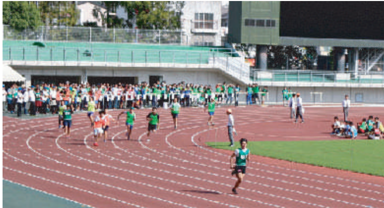
トップを走る「400mリレー(中学男女)」の御野チーム