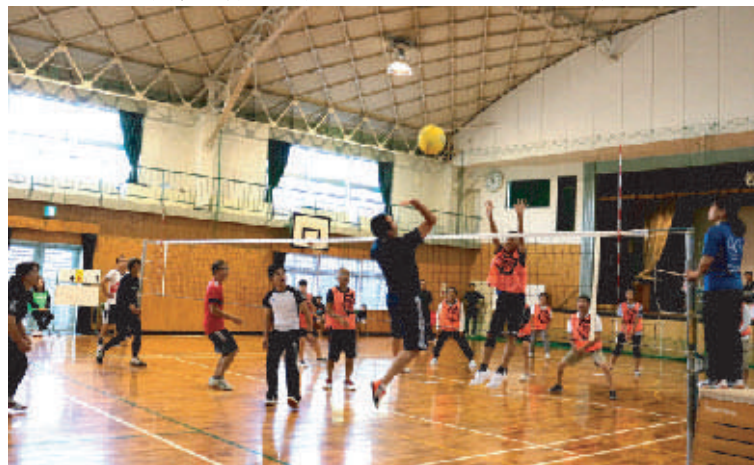
熱戦を繰り広げたソフトバレーボール大会