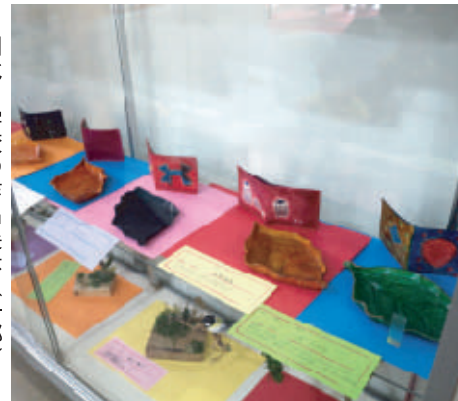
岡北中学校の作品展示（一部）