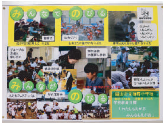
御野小学校のパネル展示