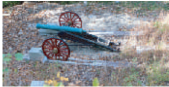
復元された「半田山の午砲台」