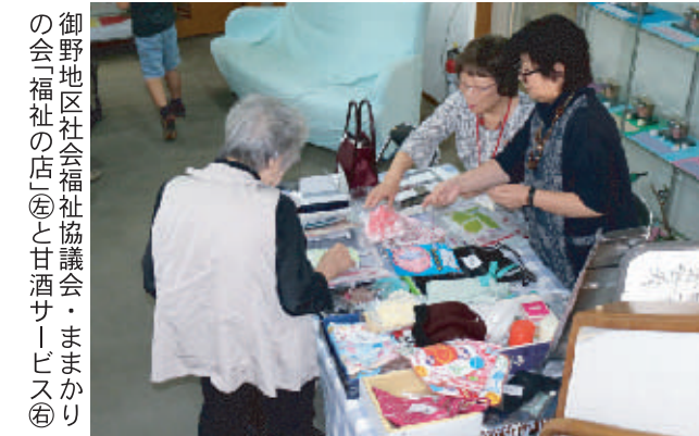
御野地区社会福祉協議会・ままかりの会「福祉の店」と甘酒サービス