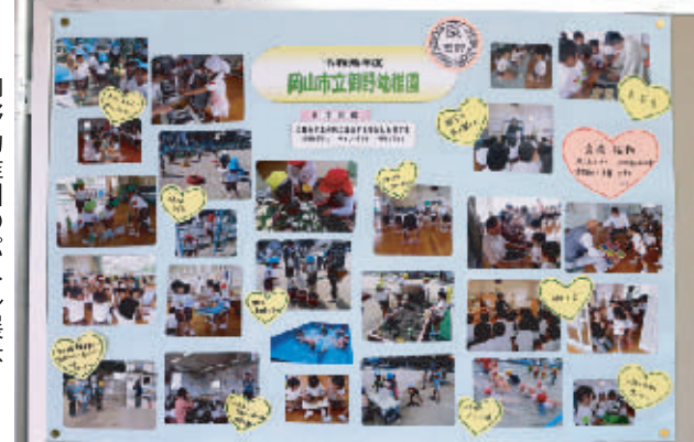
御野幼稚園のパネル展示

北公民館まつりが十月十二、十三日に開かれ、公民館クラブ講座などの発表とともに地域の諸団体も日ごろの活動を展示したり、バザー、喫茶、健康チェックなどで参加しました。一部を写真で紹介いたします。