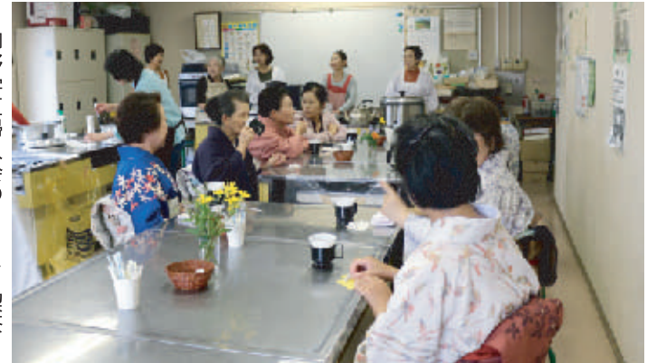
御野学区婦人会のコーヒー喫茶