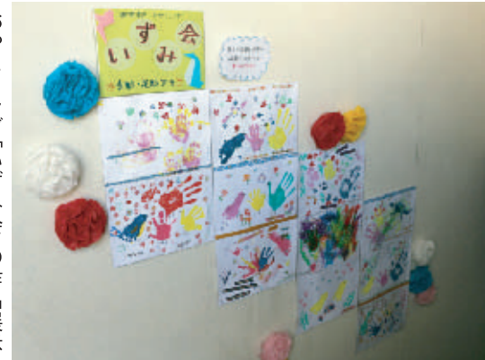
おやこクラブ「いずみ会」の作品展示