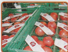
エコファーム栽培作物の供給

自然のめぐみを土に還し、その土からまた恵みを受ける暮らし。そんな素敵な輪を実現したのが環境と共生する農園「エコファーム」。毎日出る野菜くずや牛糞を、有用な堆肥に変えて健康な土を育みます。そして健康な土から、豊かで安心できる暮らしを生み出していきたい…社会のシステムそのものが環境保全を目指したものに変わっていくようにとの願いを込めて。