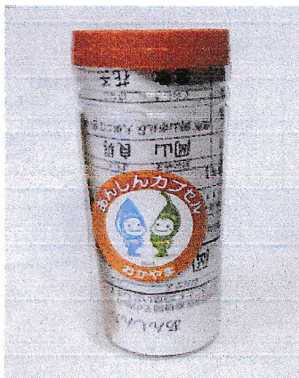
あんしんカプセル

北方東本町町内会は平成24年度より活動を開始、当初は65歳を対象に活動をしていましたが、途中で対象者を70歳まで引き上げました、今年70歳を迎えられる方には当町内会の「福祉委員」が「あんしんカプセル」の説明と設置をすすめ訪問いたします。