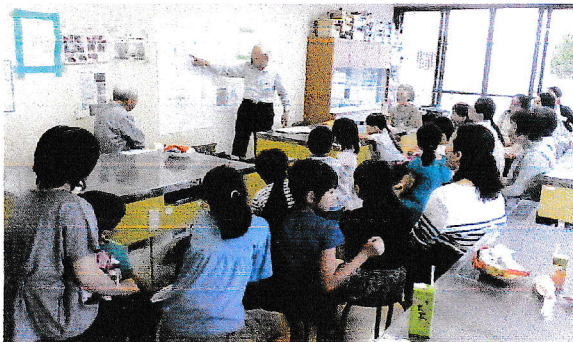
地図を見ながら真剣に聞いてます。