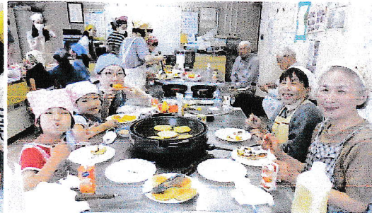
いただきます。食べるのも皆で