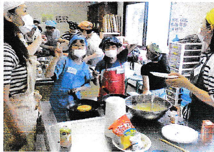
焼くのも、トッピングも皆で