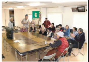
カラオケを楽しむ参加者