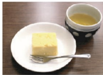
スタッフ手作りの茶菓子