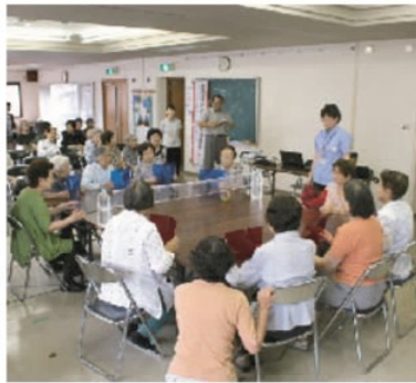
テーブルハンドサッカーに挑戦する参加者ら

「テーブルハンドサッカー」は、長尺六脚を並べてコートに見立て、中央に張ったひもを下を通るように、両手で持ったプラスチック板でボールを転がし合い、自陣内でボールが机から落ちるなどすると相手得点が入るゲームです。五人一組のチーム対戦で、試合時間は五分間。より多くの得点を稼いだ方の勝利になります。