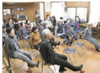
元氣よく「あっ晴れ!もも太郎体操」