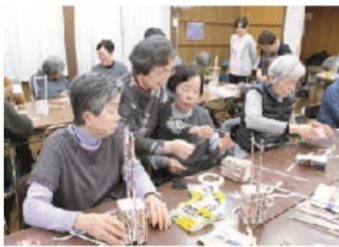
スタッフの助言で鉛筆立てが間もなく完成