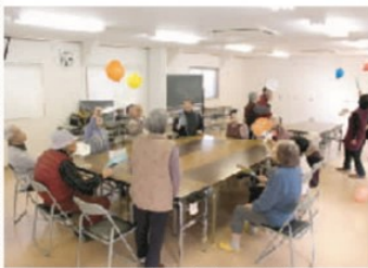
うちわで風船を打ち合う参加者