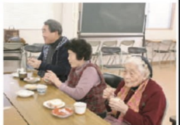
1月の誕生会でお祝いされた参加者