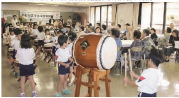
お年寄りに和太鼓演奏を披露する岡北学園の年長児

次に、岡北学園（同区津島東二丁目）の年長児二十八人が楽器の紹介を交えながら和太鼓を演奏したり、歌を歌ったりしました。またお年寄りたちと「せっせっせーのよいよい」と手遊びを楽しむ場面もありました。お年寄りは元気がいっぱい、園児たちの姿に笑顔を見せ、うれしそうな様子でした。