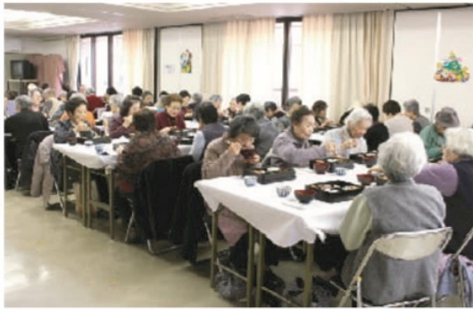
栄養委員手作りの弁当を味わう参加者ら

御野地区社会福祉協議会では、一人暮らしの高齢者、障害のある方、寝たきりの方の介護をしている家族の方など、家の中にひきこもりがちになっている人を対象に月一回程度、「元気の出る会」を実施しています。参加した人が「元気で笑顔」になれる内容が盛りだくさんです。今年度は九回開催されました。九月以降に開催された中から、九月と十二月に行われた会を紹介しましょう。