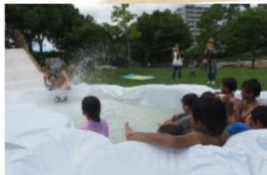
滑ってきた人の水しぶきを 浴びるのも遊び!!

「ぼくね、壊すの好き!!これ壊していい?」と誰かが作った竹の剣を男の子が持ってきました。 「それはね、Aくんが作った剣で取っとるんよ!!これだったらいいよ」と別の竹を渡すと、 男の子は夢中で竹をトンカチで叩いたり、のこぎりできったり、壊し始めました。 男の子がぼろっと一言「壊して何つくるのかな?」 その時、僕はこの子にとって壊すって言うのは、何かを作るための準備なんだと思いました。 そして、何かを作るためには何かを壊さないといけないうことを遊びの中で感じていることに 驚きました。