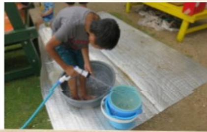
水をあてるとざるが高速回転!!