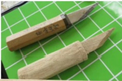
ナイフで木を削って ナイフを作る!!