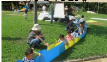
ウォータスライターの片付け みんなで川を作りました。