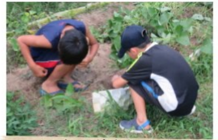
畑の草むしり 何かを見つけた様子...