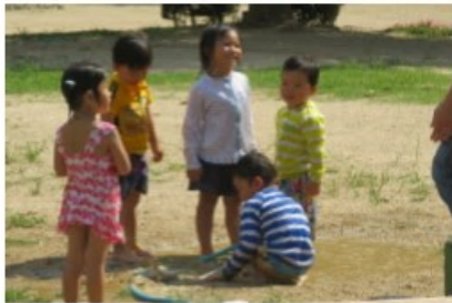
「プール!!」を作り始めるとどんどん人が増えていく。 泥の感触が楽しいみたい!!