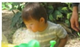
7月の森であそぼの様子 しゃぼん玉ぶくぶく