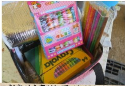
色々な方から寄付していただきました。 ありがとうございます!! ・クレヨン・色鉛筆