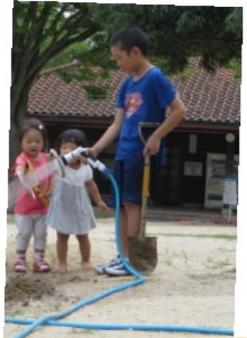
男の子は水で穴をほる。 その水を輪投げの輪に通す。 遊びが伝染していきます(>血く)