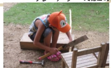
トンカチでダメなら、 のこぎりでやってみる。

主催: 特定非営利活動法人岡山市子どもセンター 〒701-0144 岡山市北区久米348 tel 086-242-1810 (月から金 10時から17時) fax 086-242-1830 E-mail info@kodomo-npo.jp ホームページ: http://www.kodomo-npo.jp フェイスブック: https://www.facebook.com/kodomonpo.okayama 後援 岡山市教育委員会