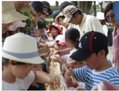
流しそうめん!! (7月30日)