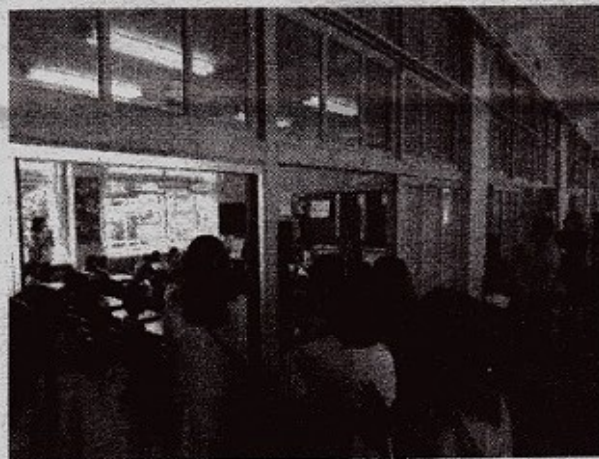
はじめての参観日