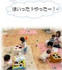
はいつたー! やったー!

ポットン落としを楽しんでいます! 丸の大小や四角の大小を用意すると、 色々考えながら真剣に遊んでいます。 四角のポットン落としは向きや位置を合わ せなければ入らないため、上から力を込め て押し込み、入らないと諦めて丸のポット ン落としに移したり様々な姿が見られま す。穴に入ると先生の顔を見ながら満面 の笑みで、手をパチパチしたり、立ち上が って喜びを表現してくれる可愛い姿も見ら れます。