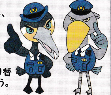
特殊詐欺被害防止キャラクター