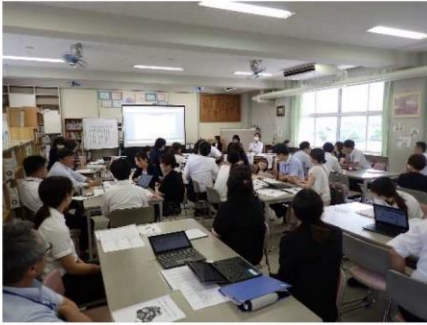
「授業後、協議会の参加者セッションと指導講評」

40名以上の参観者があり子どもたちは終始緊張していましたが、本校の研究テーマ「認め合い 自分の考えを深める子どもをめざして」に沿って構想した「ICT機器を活用した協働的な学び」の一端を公開することができました。また、「子どもたちが語り合い深め合う場を大切にしてほしい」といった従来の授業づくりでも大切にしてきた視点について改めてご示唆をいただく等、授業者を含め研究に携わった者全員が多くの学びを得る機会となりました。計画段階から本校研究に対して細やかにご指導いただいた岡山市教育委員会事務局の先生方をはじめ、当日ご参加いただいた旭東中学校区学校の諸先生方のご指導、ご助言を今後の校内の実践に反映させていきたいと強く感じた一日でした。