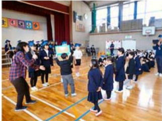
↑ 1年生と早口言葉対決!

3月1日には「6年生を送る会」を4年ぶりに全校児童が体育館に集まって実施しました。会の計画から当日の運営まで、5年生が在校生の中心となって活躍し、高学年として今年1年の間に大きく成長していることを実感しました。また、1～4年生も各学年の持ち味を十二分に発揮することができていて、「6年生に喜んでもらえる会にしよう」という思いで協力して取り組んでいました。歌、踊り、寸劇、6年生とのゲームなど多彩な出し物を考え、元気いっぱい発表することができていて感心しました。在校生の思いが、6年生に届いたすばらしい「6年生を送る会」でした。