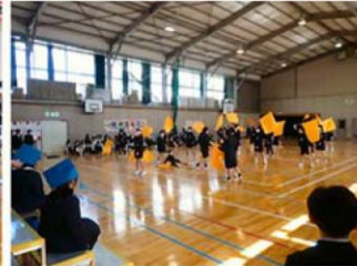
↑ 会の立役者は5年生