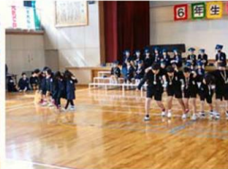
↑ 3年生と五人六脚対決!