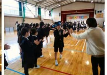
↑ みんなに見送られて退場

また、3月21日の卒業式では、4、5年生が在校生の代表を立派な態度で務めてくれました。呼びかけや歌の姿勢は、次の高学年としての活躍を期待させるものでした。3月に入ってから登校班の班長を6年生と交代し、責任をもってがんばってくれている人が多く、とても頼もしく思っています。