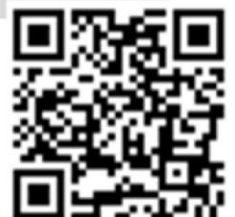
古都小ホームページ

左のQRコードから古都小学校のホームページを閲覧できます。「こづ小」で検索でもOK!