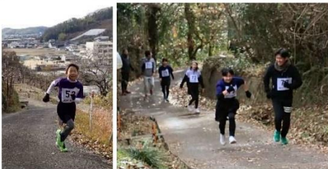
ゴールをめざして走る、走る！

12月24日（日）、第2回「古都クロスカントリー世界大会2023」が開催され、園児から大人まで約30人のランナーが古都小より岡谷八幡宮までのコースを駆け抜けました。見守りランナー、スタッフ等多くの方が子どもたちのがんばりを支えてくださいました。八幡宮のある丘からは古都学区の眺めが抜群です。レース後は栄養改善委員の方々の豚汁がふるまわれ心も体も暖まりました。