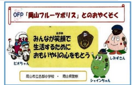
いただいたティッシュ、図柄は3種類

岡山県警の生活安全課の方から古都っ子たちにプレゼントをいただきました。非行防止のため活躍するOFP（おかやまフルーツポリス）の3人が載ったポケットティッシュです。先日、1年生が代表していただきました。「大切なきまりを守り、元気に生活してください。」というあいさつにとてもよい返事で応えていました。岡山フルーツポリスは、ネット・ニュースでも紹介されています。