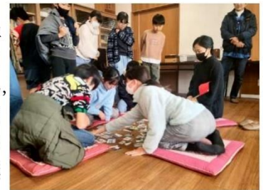
カルタを囲んで、真剣勝負！

岡山市の「岡山っ子育成条例」では、「自立する子ども」を育てる地域社会の行動指針として「地域行事の活性化」「地域行事への参加」「異世代交流」の推進が示されています。近年コロナ禍の中断で、地域行事の伝承が途切れ、参加者が集まりにくくなる状況が各地で続きますが、古都学区は「連合町内会」の方々をはじめ地域の皆様の思いを力に、行事が復活、発展しているのはすばらしいことだと考えます。「地域の子どもは地域で育てる」を合言葉に、多くの方々がこうした活動にご参加いただける状況が盛んになることを願ってやみません。