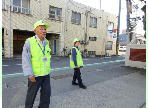
「三勲防犯 さわやかパトロール隊」