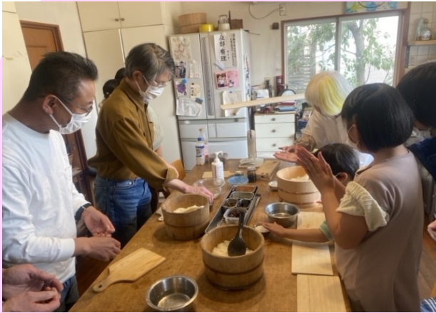
話し合いから生まれた通いの場 「おむすびdeポン!!」