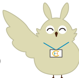
岡山市地域包括支援センター キャラクター「ほうほう」