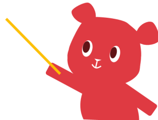
岡山市地域包括支援センター 認知症普及啓発キャラクター 「サボくま」