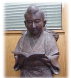
写真2 校長室所蔵 二宮金次郎像

時が流れ、人が変わるとともにその地の歴史の情報は失われていきます。しかし、古都小の子どもたちに、少しでも地域の歴史や人々の暮らしについて知らせ、故郷のことがらに興味や関心を高めて欲しいと思って、ほんの一部ではあります