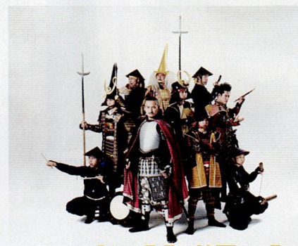
© 2009 Nagoya Omotenashi Busho-Tai Secretariat 名古屋おもてなし武将隊®