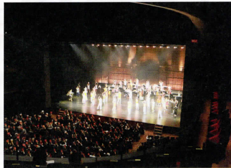
大劇場での公演の様子

「おかやまアーツフェスティバル」は、これまで長く岡山の文化芸術を支えてきた「おかやま国際音楽祭」と「岡山市芸術祭」を再構築し、岡山市の街を彩る文化芸術の祭典として今年から新たに開催されるイベントです。