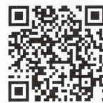
ハレノワ開館事業 特設サイト

「魅せる」「集う」「つくる」というコンセプトに沿って、優れた舞台芸術作品の鑑賞機会の提供や、アーティストと市民が出会う体験型ワークショップなどでの交流、演劇・ダンスの作品創りなどを行います。開館事業として、来年3月まで、様々な演目をお届けしますので、ぜひお越しください。