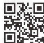
おかやまアーツ フェスティバル 公式サイト