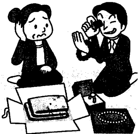
※消費者庁イラスト集より

★電話で着物など不用品を買い取ると言いながら、実際には貴金属を強引に買い取る「押し買い」のトラブルが後を絶ちません。