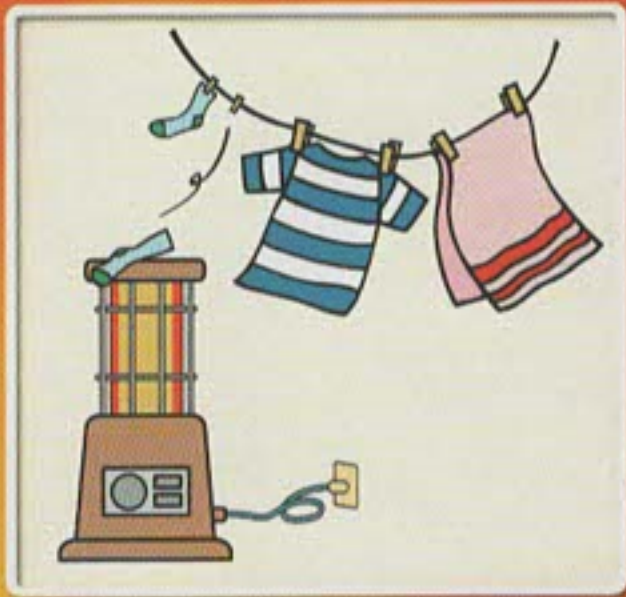
ストーブには、燃えやすいものを近づけない。