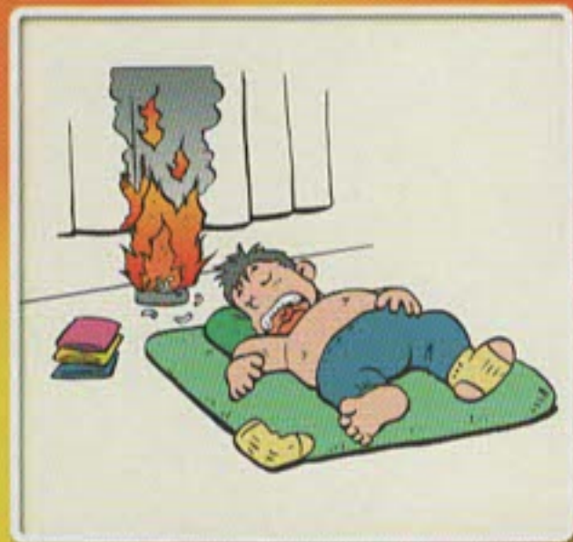
寝たばこは、絶対やめる。