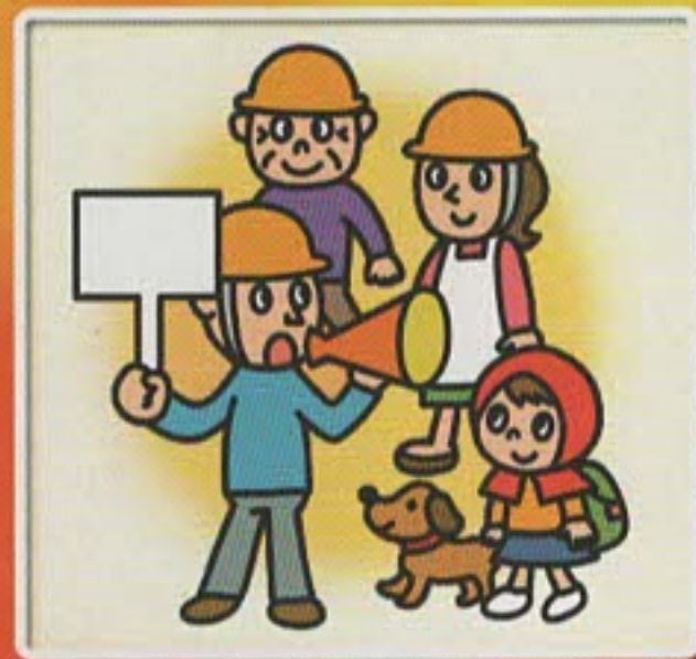
隣近所の協力体制をつくる。