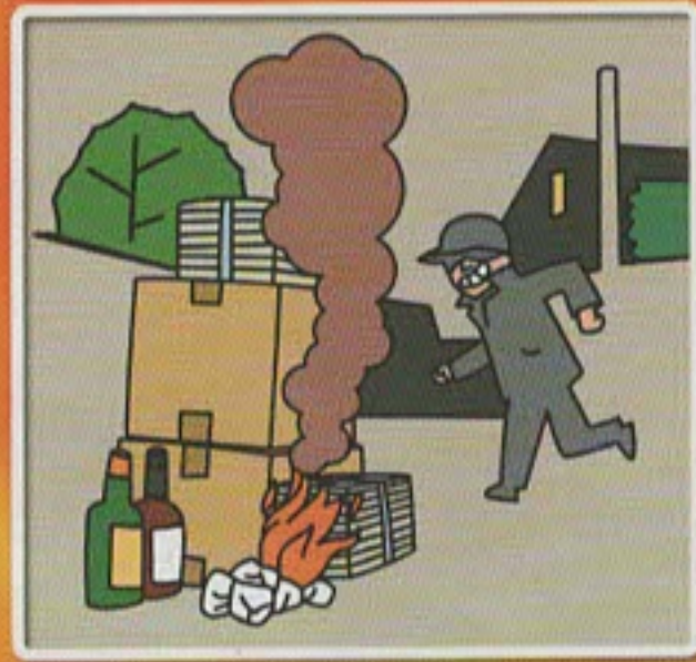
放火に繋がる燃えやすいものを建物の周囲に置かない。