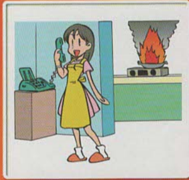
ガスこんろなどのそばを離れるときは、必ず火を消す。