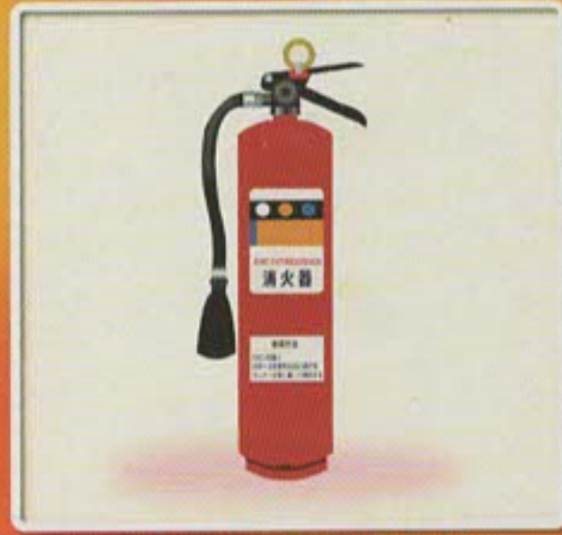
消火器等を設置する。