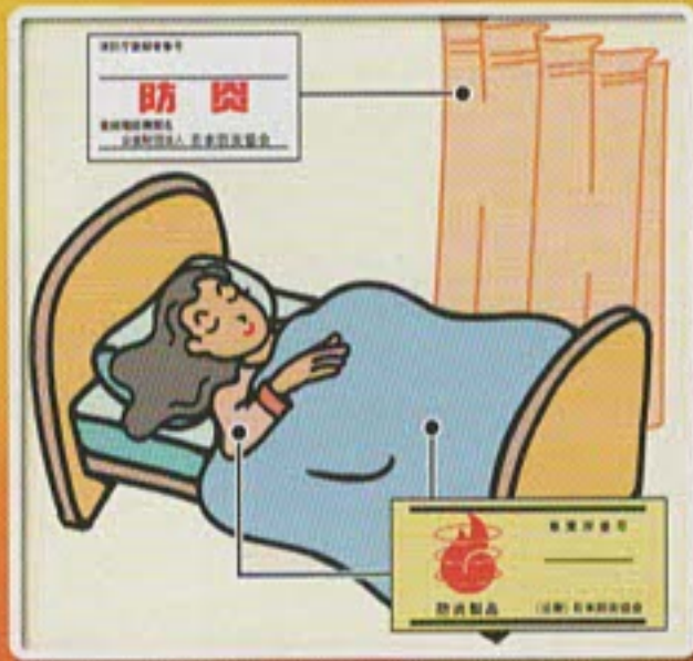
寝具、衣類等に防災品を使用する。