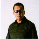
蝶野 正洋氏 (プロレスラー)