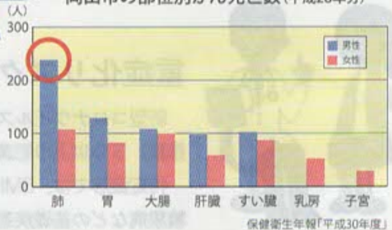
岡山市の部位別がん死亡数(平成28年分)