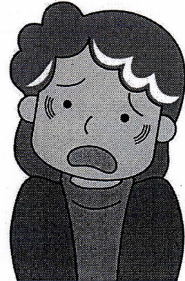
※消費者庁イラスト集より