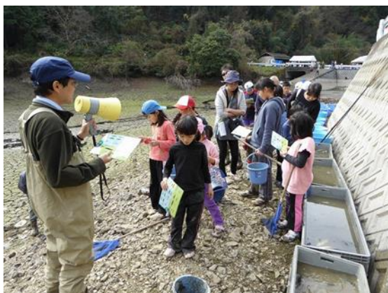
生態系調査 (池干しと併せて実施)

里地里山の在来生物を次世代に残すため、生物生態学を専門とする岡山理科大学の研究チームと連携し、小学生や地域住民が参加する生き物調査等を実施しており、生態系の重要性を学ぶ環境教育の機会となっている。1年目は、 池干し と併せて 生態系調査 と 外来種駆除 を実施。2年目は、用水路の生き物調査と 絶滅危惧種 カスミサンショウウオの 保護活動 を実施。3年目（H29年度）は、遊休農用地のレンゲ畑で 昆虫調査 やミツバチの 巣箱の設置 を行った。