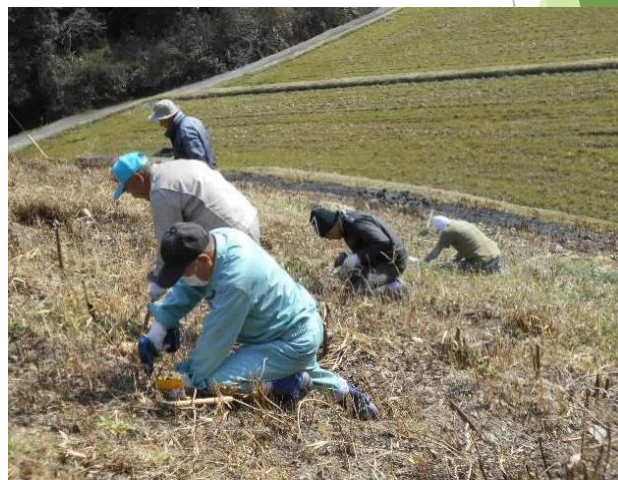
ため池法面の植物除去

ため池の堤体がイノシシに掘り荒らされないよう、法面に生えた植物（葛）の根に電動ドリルで穴を開け、薬剤を注入し枯渇させる等の維持管理を実施。