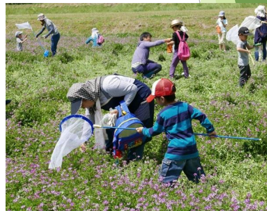
レンゲ畑で昆虫調査