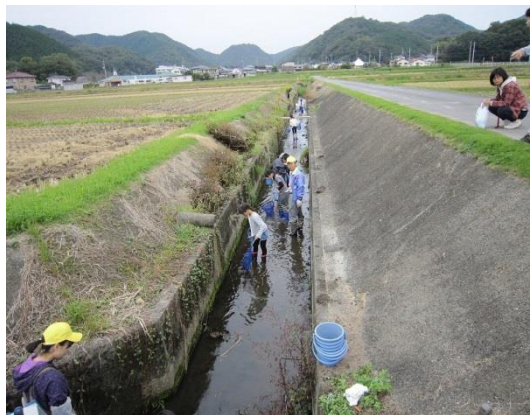
用水路の生き物調査