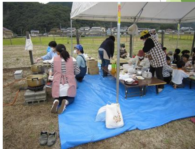
非常時の炊き出し訓練 （婦人組織との連携）

母谷里山保全会「池干し・芋掘り」 ○10月22日 玉松園跡地（岡山県） 30人の親子がため池と用水路の生き物調査、 外菜種の除去を行った。ヤブや、ホタルの幼虫 が見つかった。その後、休耕田を耕し芋畑で 芋掘りを行い、地元の新米おにぎり、餅と一 緒に大学で食べてもらった。参加した人も たちは里山の自然を楽しんだ。（大田寛喜）