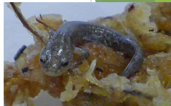
カミサンショウウオ

県のほぼ中央部に位置する 標高200～500mの内陸地域 で、 土地の約70%を山林が占める 。地域の中央部を一級河川の旭川が南北に流れている。気候は、 温暖な瀬戸内海式気候 であり、水稻中心の農業を行っている。山の芋（つぐね芋）や椎茸等の県下有数の生産地。