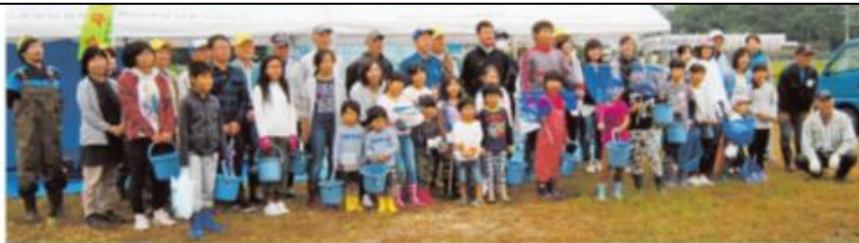
山陽新聞朝刊に活動 を掲載 2017/2/16

また、自主防災会と連携し、災害発生時における情報収集や伝達、避難誘導等について自主的な 防災活動 を実施。地域が一体となって防災力の強化に取り組む。