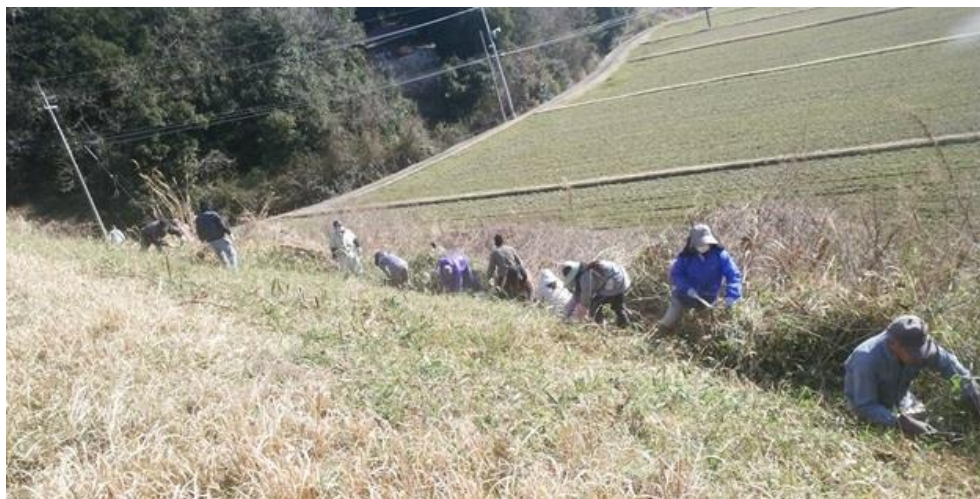
ため池周りの草刈り

水路・農道・ため池の点検及び地域住民で 草刈りや泥上げ等 を実施。刈り取った草は、地元消防団と連携して焼却処理し、生活環境の支障とならないよう配慮している。