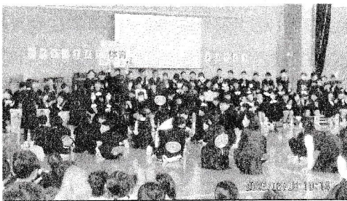
6年生を推している4年生は6年生へ「大好き！」の気持ちをクイズやダンスで伝えました。