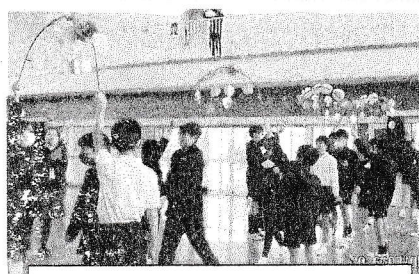
5年生がつくった花のアーチをくぐって入場しました。