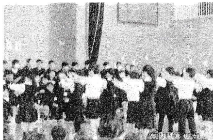
3年生からはカリスマ6年生へ♪「カリスマックス」の曲ときれきれダンスでお祝いしました。