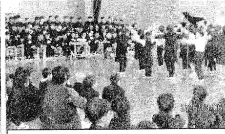
2年生は6年生が2年生の音楽会で発表した曲を再現しました。