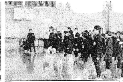
5年生は、6年生のようなかっこいい最上級生になります！と宣言しました。

6年生からは♪「ふるさと」の曲が贈られ、「かしこく・やさしく・たくましく」頑張してほしいという思いを受け継ぎました。大好きな6年生との約束を守りふるさと大野をさらによくしていきます！