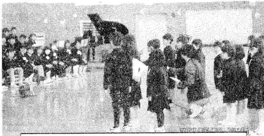
1年生は♪「どきどきどん1年生」の歌をプレゼントしました。