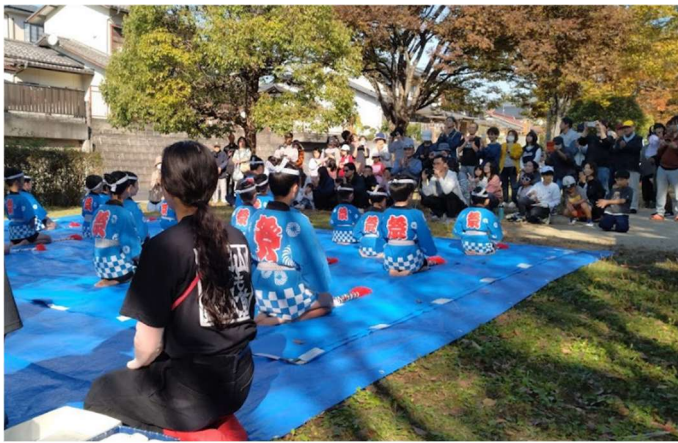
半田山こども銭太鼓会