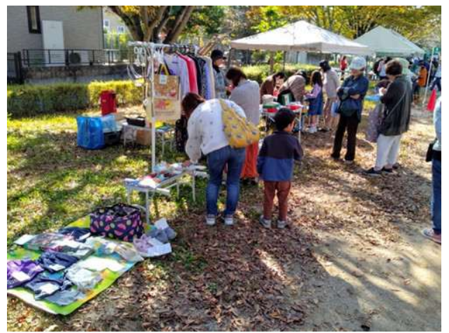
フリーマーケット