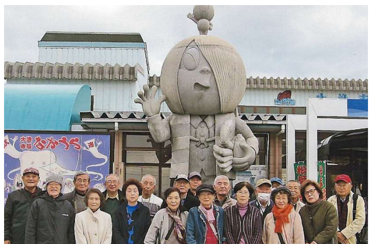
大漁市場「なかうら」背景は巨大な鬼太郎像

11月18日に「秋の親睦旅行 大根島と境港の旅」で楽しい日を過ごしました。大根島由志園では雨に煙る日本庭園のすばらしさに感動を覚えました。さらに、水木しげるロードの散策では「ゲゲゲの鬼太郎」の妖怪を見ながらNHK放映の話と鬼太郎列車を眺め、雨上がりの楽しいひと時を過ごしました。