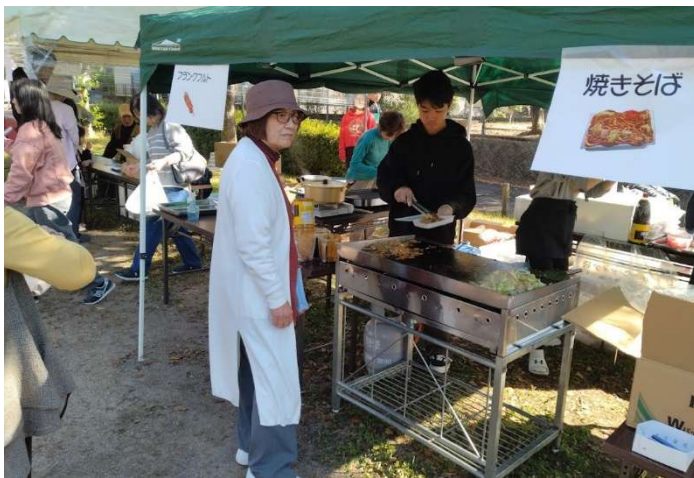
焼きそばとフランクフルトの販売