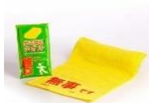
安否確認タオル 安否確認タオル