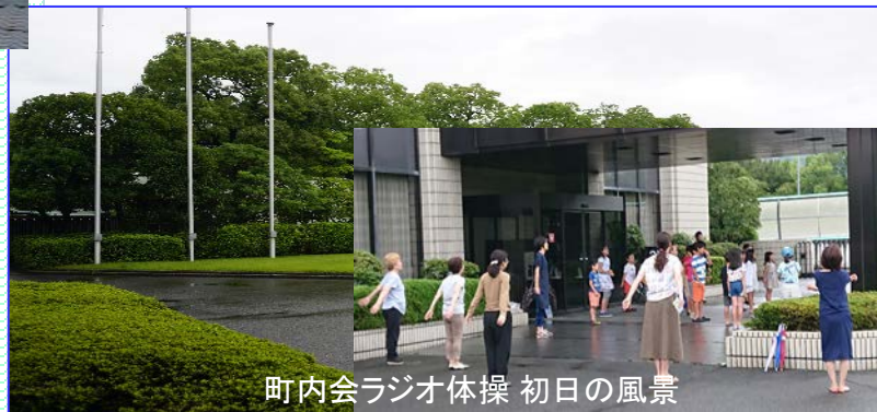
町内会ラジオ体操 初日の風景