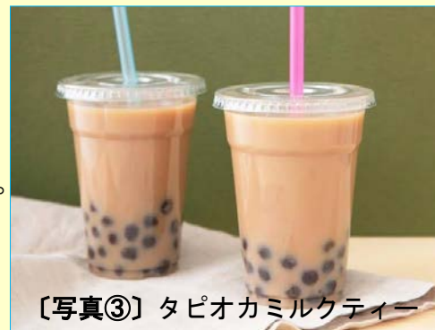
【写真③】 タピオカミルクティー

また、ご存じの方も多いかもかもしれませんが、黒タピオカドリンク発祥の地である台湾は、近年、日本人の海外旅行先として絶大な人気を誇っています。一般社団法人日本旅行業協会が、旅行会社を対象に調査をした「人気旅行先ランキング」では、台湾は年末年始の旅行先で4年連続1位、GWの旅行先では5年連続で1位に輝いています。夏休みの旅行先でも、ハワイとトップを争うのが近年の傾向となっています。