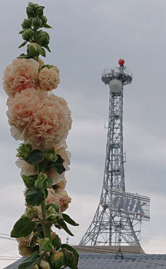
八重咲き立葵(ホリホック)と 町内会のシンボルタワー