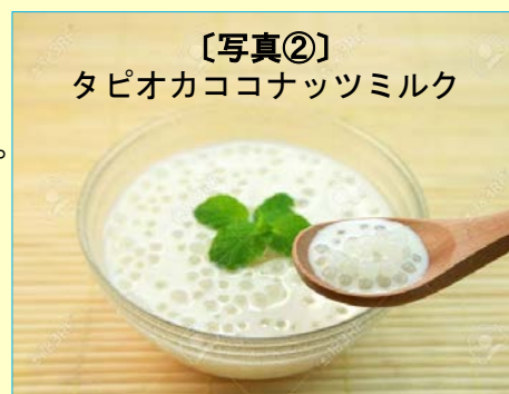
【写真②】 タピオカココナッツミルク

タピオカには大きく分けて3回のブームがありました。はじめのブームは1992年です。このときは、現在人気となっているタピオカミルクティーとは異なり、甘いココナッツミルクに白い小さな粒のタピオカをいれた「タピオカココナッツミルク」が流行りました【写真②】。この頃、エスニック料理が流行り、特にタイ料理が人気となり、デザートとして提供されたのがこのココナッツミルクタピオカだったので